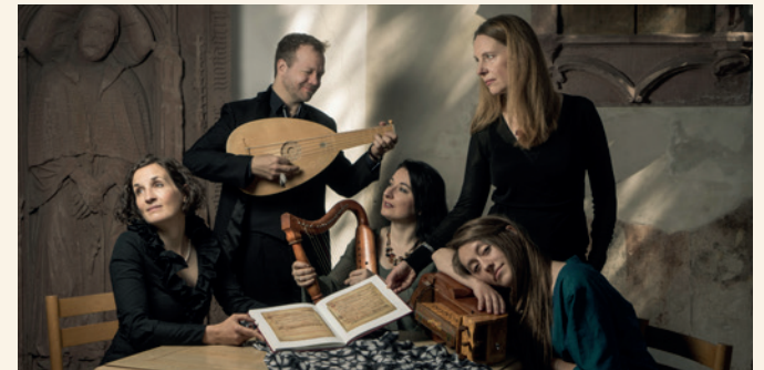
Ensemble Peregrina

In Kooperation mit der Reihe „Via Mediaeval“ des Kultursommers RLP