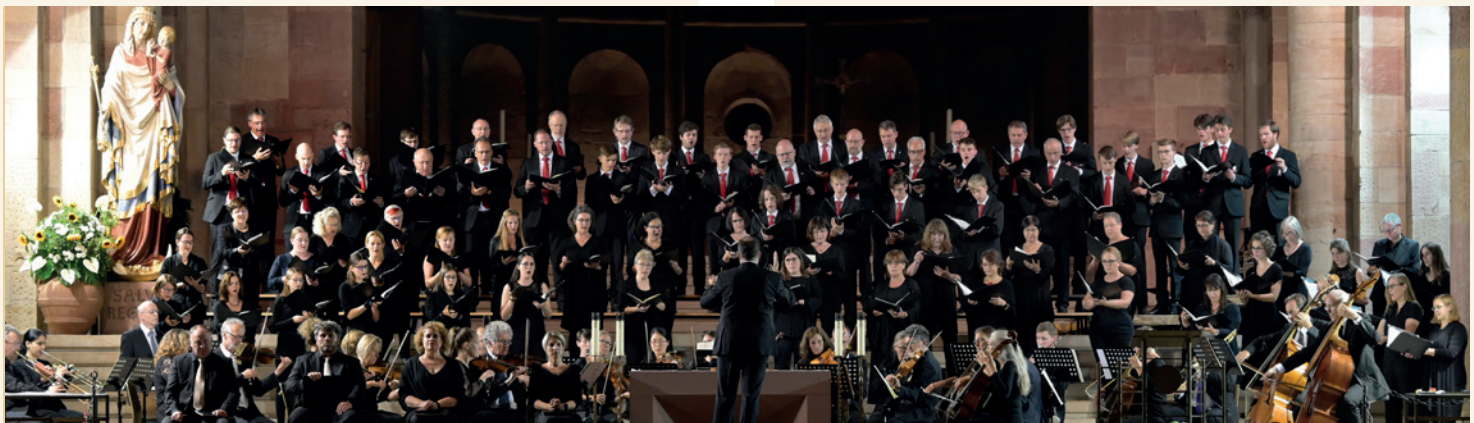
Domchor Speyer, Barockorchester L'arpa festante