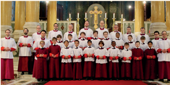
Westminster Cathedral Choir

SONNTAG, 25.09.2022, 17:00 UHR KLOSTERKIRCHE ST. MAGDALENA