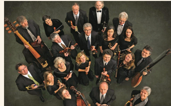
Barockorchester L'arpa festante