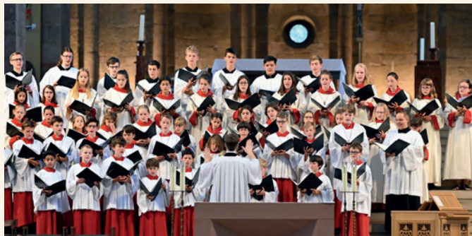
Mädchenchor am Dom zu Speyer und Speyerer Domsingknaben

SONNTAG, 18.09.2022, 16:00 UHR DOM-KRYPTA